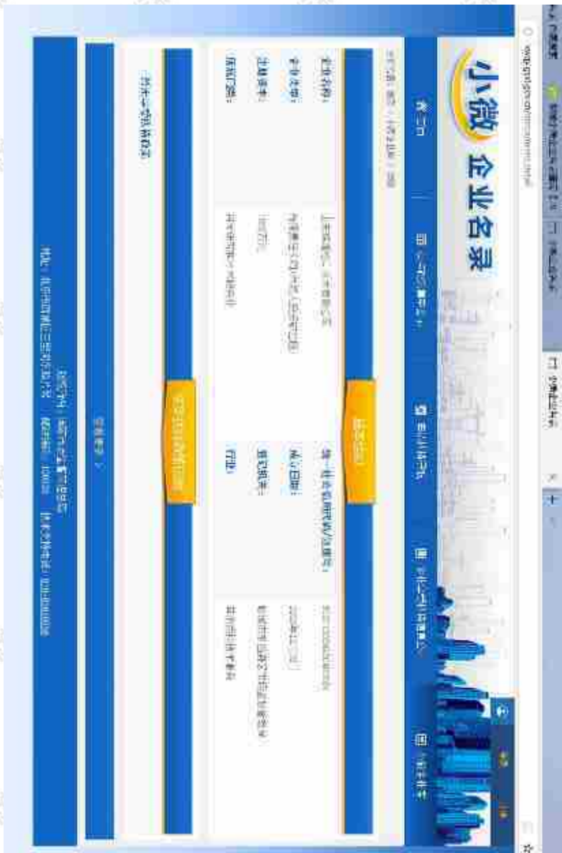
中小企业网站截图